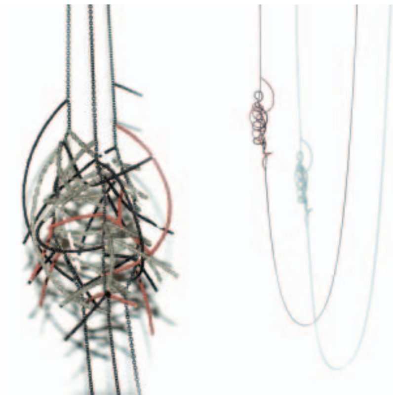
Ketten Kokon und Ranke , 2011. Geschwärzte Silberkette, Glasperlen, Nylon.