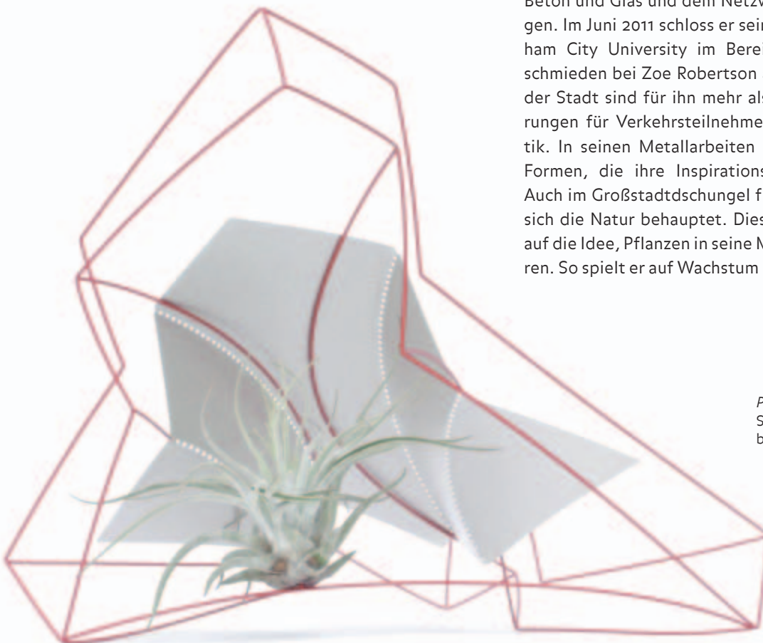
Pflanzengefäß 4 , 2011. Silber, Stahl, pulver- beschichtet, Luftpflanze.