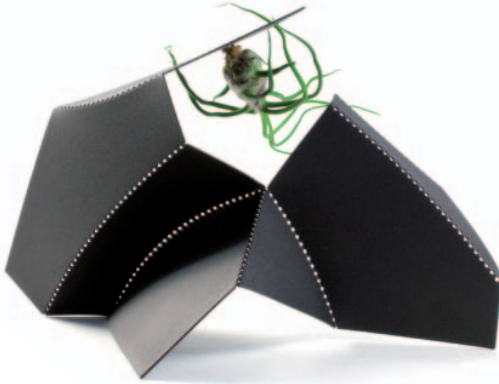
Pflanzengefäß 2 , 2011. Metall, pulverbe- schichtet, Luftpflanze.