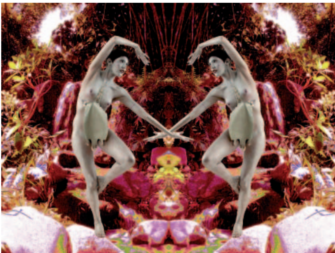
Spiel mit der Illusion: Videoszene aus Amazon , 2011.