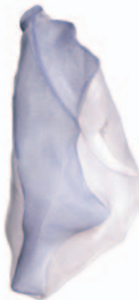
Broschen aus der Serie Leave no grain unturned , 2011. Seide, Nylon, Magnet, 11 × 25 × 11 cm, 11 × 19 × 14 cm.