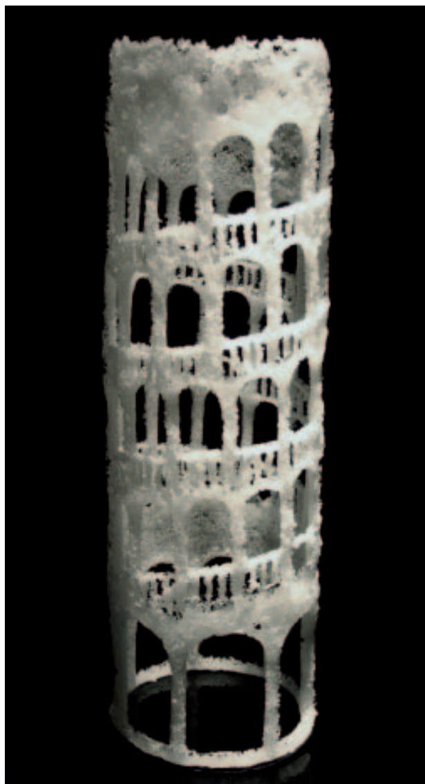
Glasobjekt Venice IV , 2011. Bleikristallglas, pâte de verre, 49 cm hoch.