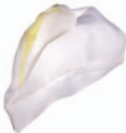
Schalenobjekt Jellyfish . Polypropylen, Harz, Lack, 28 × 23 × 21 cm.